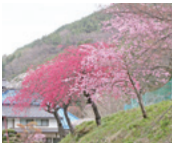
③トキノスコース (0.7km) 余里では、普段の生活を忘れゆっくりと花桃を眺められます。