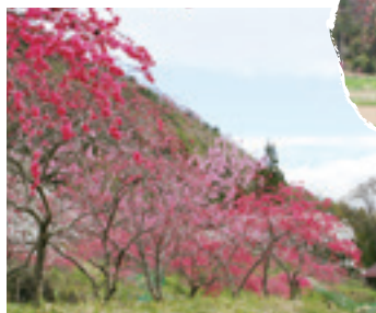
②中央農道コース (1.2km) 新緑の中から見下ろす花桃は、また違った景色が楽しめます。