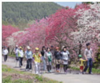
④宮前コース (0.6km) 赤白の花桃が咲き乱れる“世界中で一番きれいな二週間”は、見る人に感動を与えます。