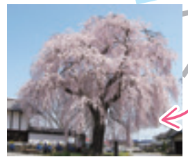
信廣寺のしだれ桜(4月中旬)