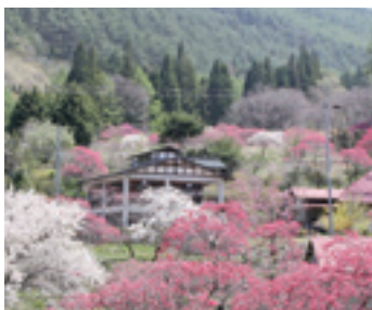
①ホドガイコース (0.3km) 山畑に咲く花桃を間近に見られます。